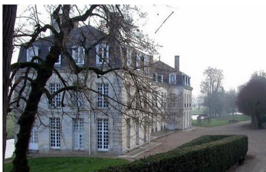
Le château de Rochambeau nous ouvre son domaine

Contact – inscription : 06 85 71 02 50 - j.colas41@orange.fr