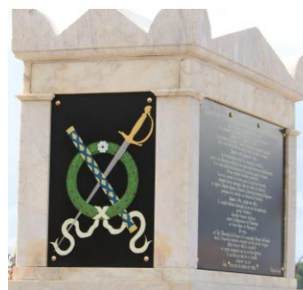
Tombeau de la famille ROCHAMBEAU